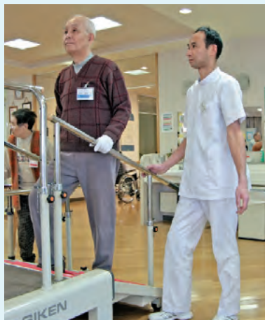
階段を使用しての下肢訓練。