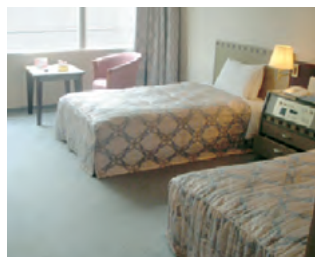
車椅子専用客室(ツイン)