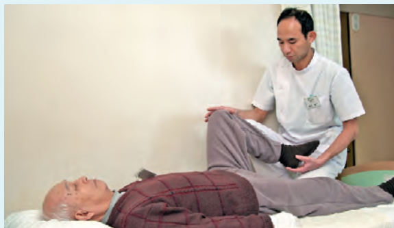
理学療法士によるベッドサイドの訓練。