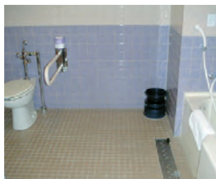
車椅子専用客室(サニタリー)

「バリアフリー」という言葉をよく見聞きするようになりました。しかし、実際に車椅子の生活をされている方々にとっては、「フリー」とは言いきれない施設・設備も存在しています。ですから、遠くへ旅をする方々には不安は一層大きいものになると思います。旅の好きな方は大勢いらっしゃいますが、安心して泊まれる「バリアフリー」の宿に関する情報は圧倒的に不足しているのが現状です。今回は旅の好きなお年寄りにおすすめな宿を紹介いたします。